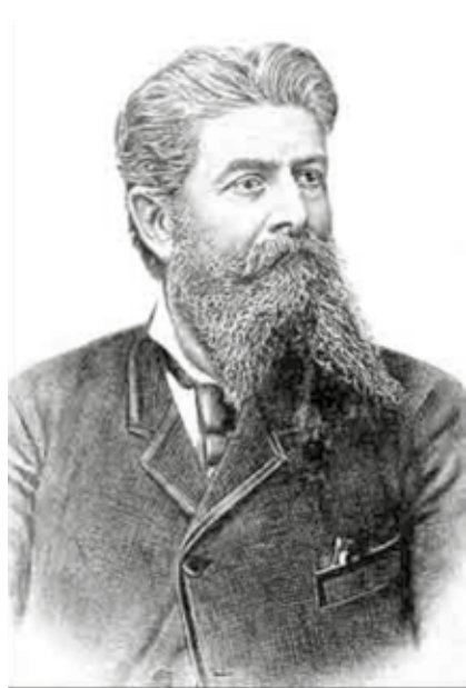
Василий Васильевич Юнкер (1840–1892)

Европейцы издавна довольно хорошо представляли северные части Африки, странствовали вдоль берегов континента, арабские путешественники и торговцы осваивали его север, северо-восток и восток, китайские мореплаватели достигали восточных частей Африки. Но до XIX века обширные пространства внутри материка оставались известными только для местных жителей. Труднопроходимые дремучие леса и огромные пустыни ограничивали возможности чужестранцев. Местные реки также не благоприятствовали исследователям. Да и многие африканские народы не отличались особым гостеприимством, в том числе и потому, что в этих районах с давних пор процветала торговля рабами, которой способствовали многие арабские, европейские, а позже и американские купцы.