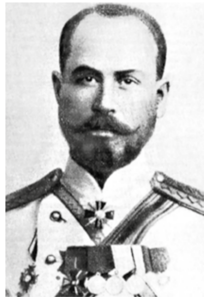
Александр Ксаверьевич Булатович (1870–1919)

В конце XIX века внимание русских исследователей привлекла Эфиопия. Среди них нельзя не вспомнить Александра Ксаверьевича Булатовича, история которого очень сжато и не совсем правильно рассказана Остапом Бендером в знаменитом романе И. Ильфа и Е. Петрова «Двенадцать стульев». А.К. Булатович изучил многие районы тогдашней Эфиопии, охарактеризовал течение целого ряда рек в бассейне Голубого Нила. Его исследования получили высокую оценку, он был награждён Серебряной медалью Русского географического общества. Дальнейшая судьба Александра Ксаверьевича оказалась сложной: