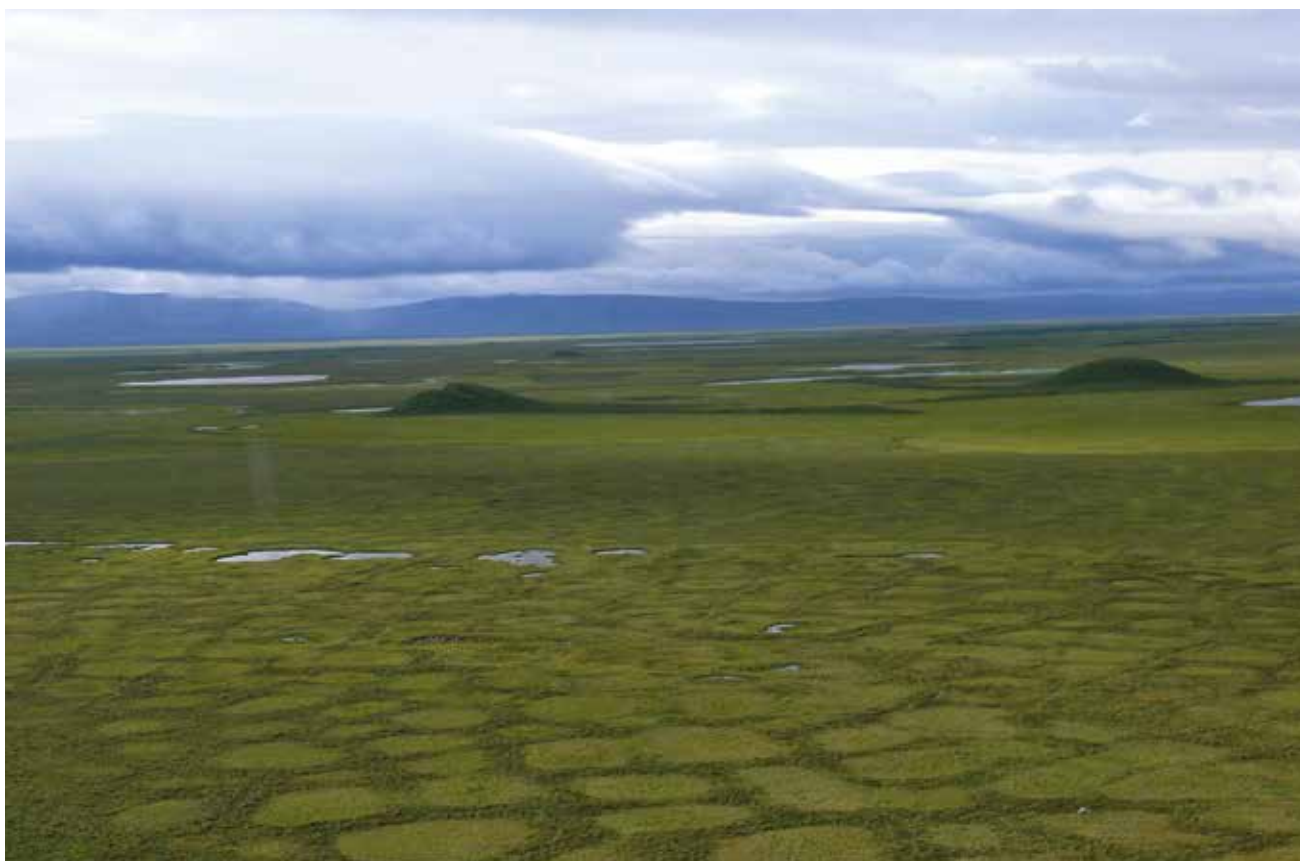
Полигональная тундра.

Долгое время люди не могли поверить, что земля может промерзнуть настолько глубоко. Всех убедил в 1838 году любознательный житель Якутска Фёдор Егорович Шергин. Ему удалось пробить колодец в мёрзлой почве глубиной 116,6 метра.