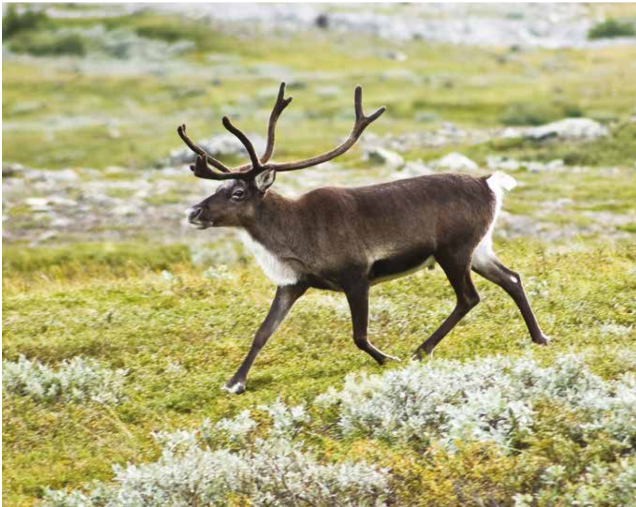
Северный олень.

Именно в Якутии можно увидеть самые яркие проявления многолетней мерзлоты – бескрайние просторы тундр расчерчены своеобразным узором из многочисленных многоугольников. Это полигональные тундры. Такая картина образуется потому, что ледяные жилы в почвах из года в год увеличиваются, выжимая рыхлые грунты на поверхность. Когда вытесненные из глубин валики замерзают, они образуют многоугольники, «расчерчивающие» поверхность тундры на клеточки. Летом же жилы льда в верхних частях подтаивают, и полосы между многоугольниками оказываются заполненными водой.