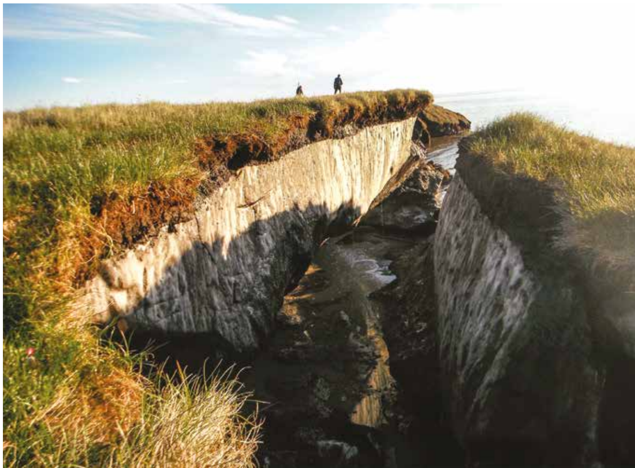
Многолетняя мерзлота под слоем почвы.

Многолетняя мерзлота – это горные породы и почвы, находящиеся в мёрзлом состоянии, то есть имеющие отрицательную температуру на протяжении длительного времени. Характерной чертой мёрзлых пород является их высокая льдистость. Подземный лёд бывает двух видов.