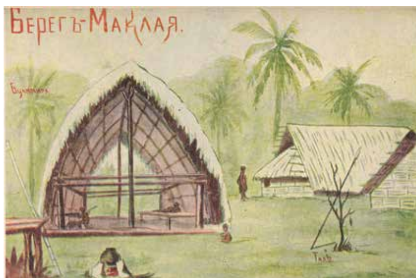
Зарисовка Н.Н. Миклухо-Маклая, сделанная на северо-востоке Новой Гвинеи; https://ru.wikipedia.org