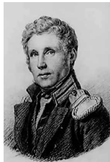
Отто Евстафьевич Коцебу (1787–1846).

В 1820 году Новую Зеландию и ряд островов крупного архипелага Туамоту исследовали участники антарктической экспедиции под командованием ещё одного члена первого русского кругосветного плавания Фаддея Фаддеевича Беллинсгаузена (Фабиана Готтлиба Бенъямина фон Беллинсгаузена) и Михаила Петровича Лазарева на шлюпах «Восток» и «Мирный». Мореплаватели уточнили описания многих островов, а также нашли острова, ранее неизвестные европейцам. Фёдор Петрович Литке (Фридрих Бенъямин фон Лютке) в 1826–1828 годах руководил экспедицией на шлюпе «Сенявин». Участники плавания исследовали некоторые острова Каролинского архипелага и архипелага Бонин.