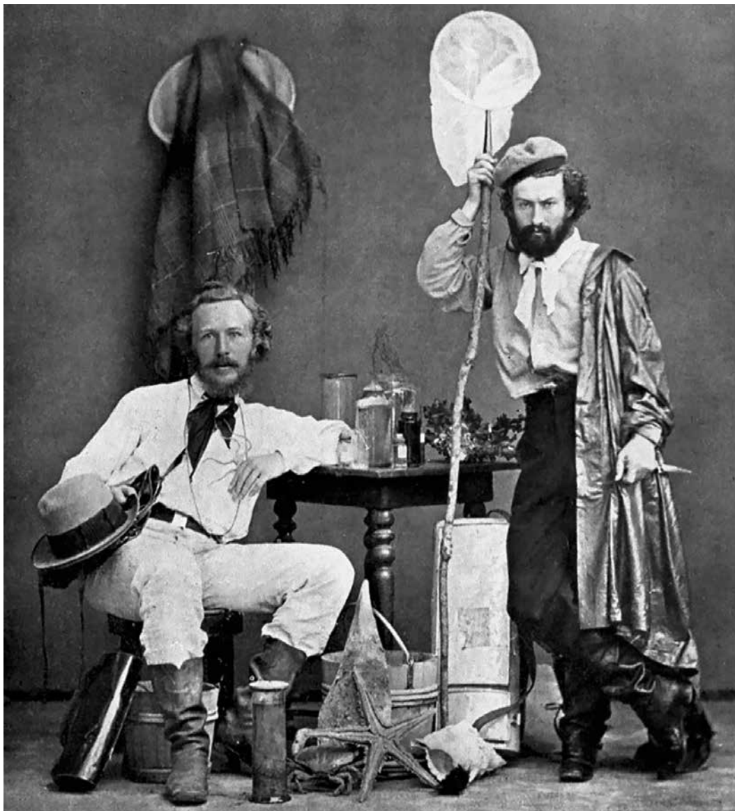
Эрнст Геккель (слева) и Николай Николаевич Миклухо-Маклай (1846–1888) (справа) во время экспедиции на Канарские острова (1866)

Русские морские экспедиции первой половины XIX века внесли огромный вклад в познание Океании: первыми из европейских экспедиций открыли некоторые архипелаги и отдельные острова, уточнили описания многих уже известных островов, собрали огромные коллекции живых организмов, провели тщательные метео- и гидрологические наблюдения. Правда, почти все новые географические названия, предложенные участниками этих экспедиций, были позже на картах замещены названиями, которые использовали коренные обитатели островов. Одно из немногих исключений – острова Раевского в архипелаге Туамоту, впервые описанном Беллингаузеном.