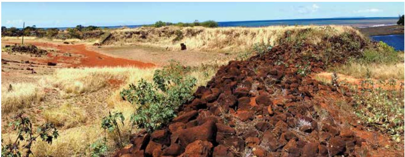
Остатки стен Форта Елизаветы.