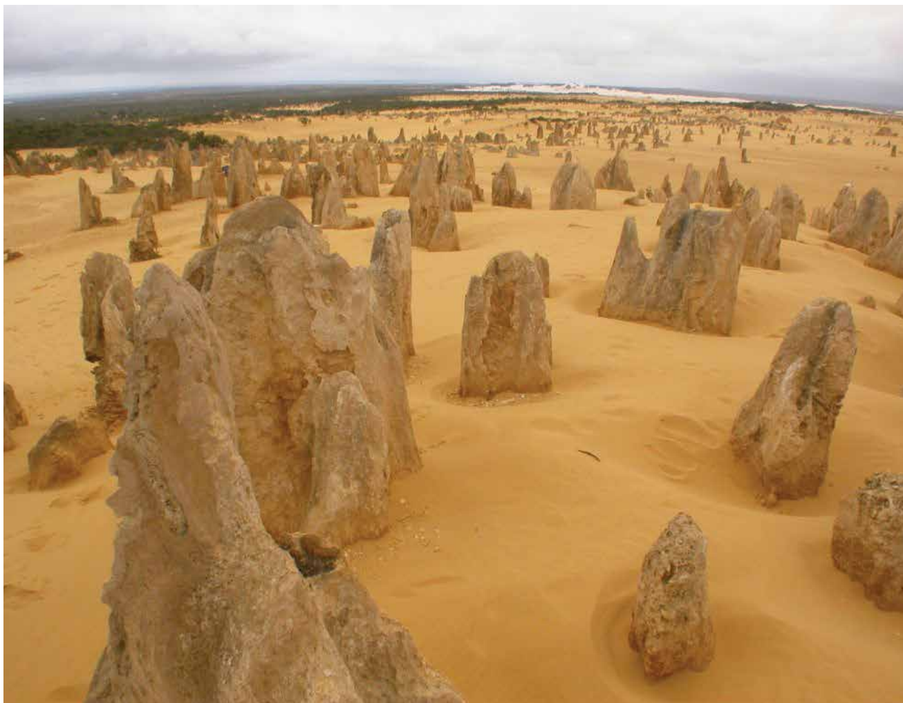
Пустыня Пиннаклс.

На первый взгляд, эта ящерица похожа на еловую шишку. На голове и спине у неё шероховатые и бугристые чешуи, крупные и грубые. Хвост очень короткий и толстый, что и отражено в названии. Это медлительная и тяжеловесная рептилия с короткими и слабыми ножками, которые, если она шествует, чуть-чуть приподнимают тело над землей. Если поймать короткохвостого сцинка, то он в раздражении испускает шипенье или фырканье и высовывает ярко окрашенный язык. Как и у многих других сцинков, язык у короткохвоста окрашен в оттенки синего цвета.